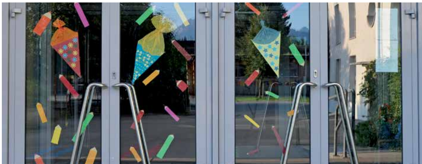
Ausgaben für Bildung und Betreuung von Kindern und Jugendlichen ist ein ständig wachsender Faktor im Gemeindebudget.