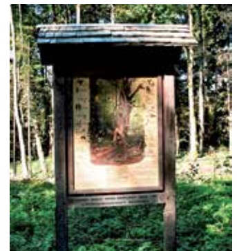
Im Oberauwald informieren zwei Lehrtafeln über den Stoffkreislauf im Wald und die Bedeutung des Totholzes.