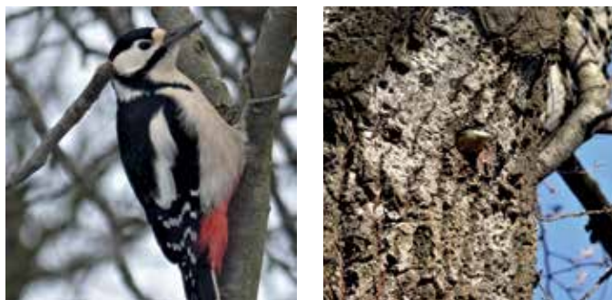
Zimmermeister Specht und Nachmieter Kleiber.

Totholz – ein Paradies für holzbewohnende Käfer. Rund ein Fünftel der etwa 4000 Käferarten Vorarlbergs leben auf oder im Holz. Viele stehen auf der Roten Liste. Sie sind von großer Bedeutung für das Ökosystem Wald, nicht nur indem sie Holz abbauen, sondern auch durch ihre Fraßstätigkeit Nistmöglichkeiten für Vögel schaffen und für Fledermäuse und Vögel eine wichtige Nahrungsgrundlage bilden.