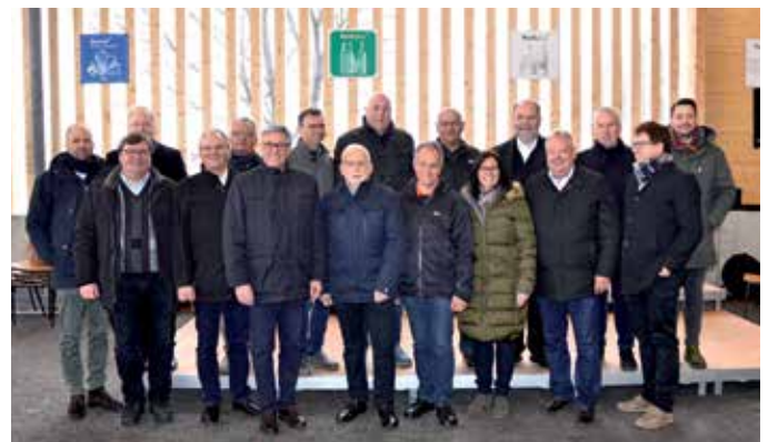
Oben und Mitte: Eröffnung Altstoffsammelzentrum (ASZ) Feldkirch und Vorderland.