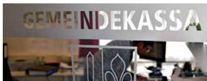
Die Gemeindekasse wird künftig zu einem guten Teil von der Finanzverwaltung Vorderland mitbetreut.

Die Verwaltungsgemeinschaft wurde im Herbst 2011 im Regio-Zentrum Sulz eingerichtet und übernimmt weite Teile der finanziellen Agenden der beteiligten Gemeinden. Neben den üblichen Buchhaltungsarbeiten steht vor allem das strategische Finanzmanagement im Fokus. Zu den Hauptaufgaben gehören unter anderem die Erstellung von mittelfristigen Finanzplanungen, das Darlehensma-