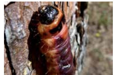
Scharlachroter Plattkäfer und dessen Raupe

Ein holzbewohnender Käfer wird meist mit „Schädling“ assoziiert. Bietet der Wald jedoch viel Unterwuchs und genügend Totholz, so nimmt die Vielfalt der Käferarten zu. Gleichzeitig vermindert sich aber auch das Risiko von Massenvermehrungen forstlich relevanter Käfer. Seit Längerem hat auch in Meiningen, was die Waldbewirtschaftung betrifft, ein Umdenken hin zu natürlicher und gezielter Verjüngung und Belassen von Totholz eingesetzt. Durchforstung im ohnehin standortfremden Fichten-Stangenholz sowie langfristige Umwandlung in einen Laubmischwald sind zwei wesentliche Maßnahmen der Agrargemeinschaft Meiningen. So lässt es sich dem auf die Fichte spezialisierten Borkenkäfer zu Leibe rücken.