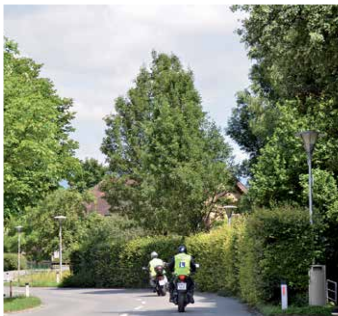
Die Straßenbeleuchtung in Meiningen wird optimiert.

Im Zuge der Ortsplanerstellung wird auch ein Optimierungsbericht verfasst. In diesem Bericht werden die Optimierungspotenziale hinsichtlich Beleuchtungsqualität, Energieeffizienz und Kostensenkung analysiert. Die Gemeinde Meiningen hat dann fundierte und realistische Zahlen, um Maßnahmen für eine mögliche Kosteneinsparung zu prüfen. Zudem wird ein Sanierungsplan für die Modernisierung der Straßenbeleuchtung und Umstellung auf LED-Leuchten erstellt. Aufschlussreich wird dann der Jahreskostenvergleich der Strom- und Wartungskosten vor und nach einer eventuellen Umstellung auf LED-Leuchten sein. Dieser Kostenvergleich ist dann die Grund-