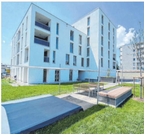
Von Rhomberg Bau fertiggestellte Wohnanlage in der Dornbirner Straße in Lustenau.