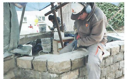
Die Dorfbrunnen in Ludesch konnten dank LEADER saniert und damit für die Nachwelt erhalten werden.