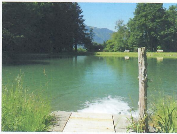
Der Thüringer Weiher wurde saniert.