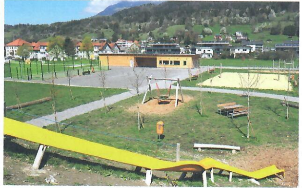
Der Freizeitplatz in Bludenz wurde mit LEADER-Mitteln umgesetzt.

Neben gemeindeübergreifenden Projekten wie etwa der „Vermarktungsdrehscheibe“, über die landwirtschaftliche Produkte in die Großküchen der Region finden, die Handwerkscontainer der Wirtschaft im Walgau, oder dem Alpine Art-Kunstwanderweg am Muttersberg sind es vor allem Kleinprojekte, welche das Zusammenleben bereichern.