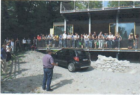
Die Sennerei Schnifis hat ein Konzept entwickelt, um ihren Markenauftritt zu verbessern.