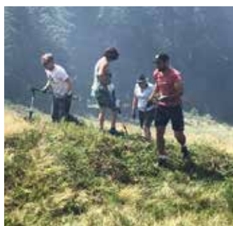
Fleißige Helferinnen und Helfer beim Schwenden