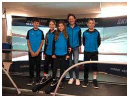
Training mit dem Skisimulator, wie die Profis

Mit der Jahreshauptversammlung wurde im offiziellen und sehr angenehmen Rahmen das Schivereinsjahr im Hotel JUFA beendet und das neue Schivereinsjahr will-