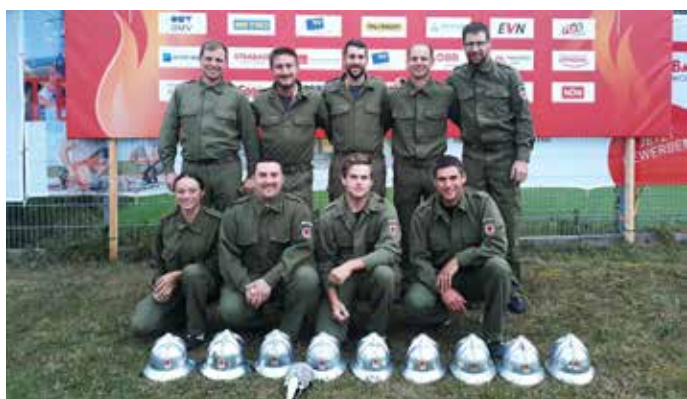
Wettkampfgruppe Laterns 1

Die Wettkampfgruppe 1 erreichte beim diesjährigen Landesleistungsbewerb in Schnifis in der Klasse "FLA Bronze A" den 23. und in der Kategorie "BFLA Bronze A" den 6. Rang. Bei den Nassbewerben am 09. Juli in Göfis stoppte die Zeit bei 46,54 Sekunden, leider mit zehn Fehlerpunkten. Dies ergab in der Endwertung den 7. Rang in der Klasse ohne Alterspunkte. Das Highlight und den Abschluss des Wettkampfjahres bildete der Bundesfeuerwehrleistungsbewerb Ende August in St. Pölten. Hier durften wir nach erfolgreicher Qualifika-