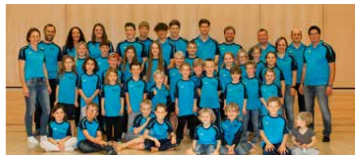
Unser aktueller Kader

Und es ist schön, dass uns so viele Laternerinnen, Laterner und Schivereinsmitglieder dabei unterstützen – DANKE!