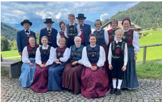
Unsere Trachtenträger beim Notburgafest