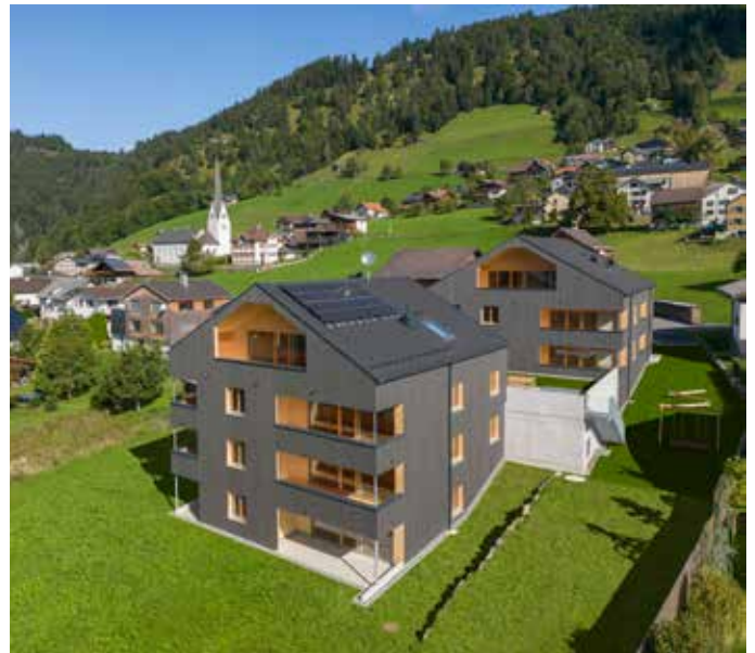
Fertige Wohnanlage Unterkirchdorf