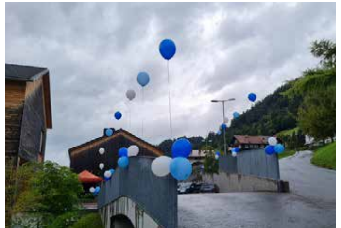
Besucher herzlich willkommen

Es war ein sehr toller Nachmittag mit vielen strahlenden Kinderaugen.