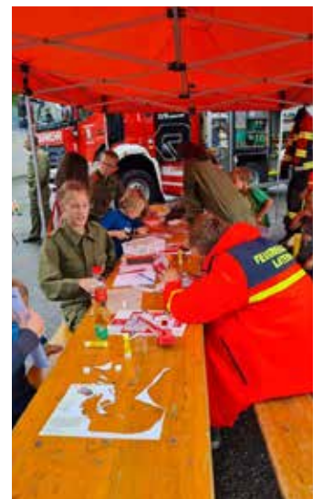
Alle im Einsatz