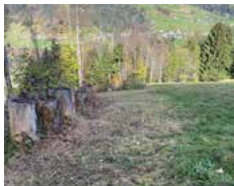
Schwendarbeiten Gapfohl - Wies