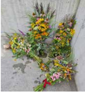
Die fertigen Sträuße ...

Aus verschiedensten Blumen und Kräutern banden wir farbenprächige Sträuße für Maria Himmelfahrt.