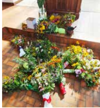
... zur Segnung bereit