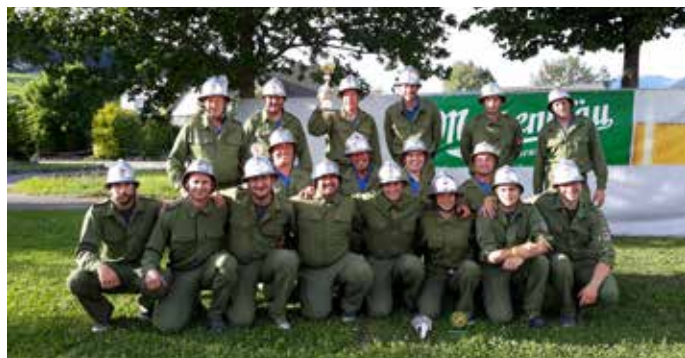
Bezirksnassleistungsbewerb in Göfis: Wettkampfgruppe Laterns 1 und Laterns 2

Die Wettkampfgruppe 2 erreichte am 25. Juni beim Nassleistungsbewerb des Bezirk Landeck in der Gästeklasseklasse B mit Alterspunkte den 1. Rang (56,83 Sekunden). Beim Nassleistungsbewerb in Göfis am 9. Juli konnte der Löschangriff in der Zeit von 49,54 Sekunden (+10 Fehlerpunkte) beendet werden. In der Klasse B mit Alterspunkte ergab dies den 3. Rang. Ein besonderer Dankt gilt allen Teilnehmern der Gruppe sowie den Helfern, Zuschauern, Fahrern und sonstigen Unterstützern.