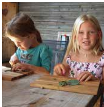
Alle haben mitgeholfen