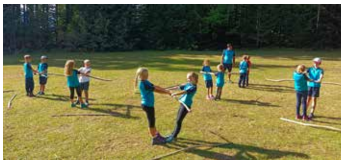
Sommertraining „Summer in the nature“