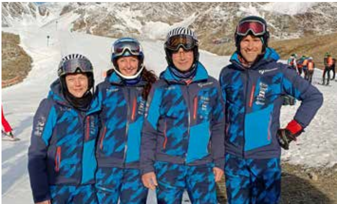
Stubaitaler Gletscher im Oktober