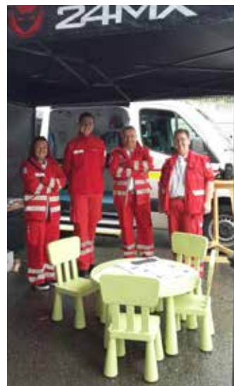
Für alle Fälle bereit