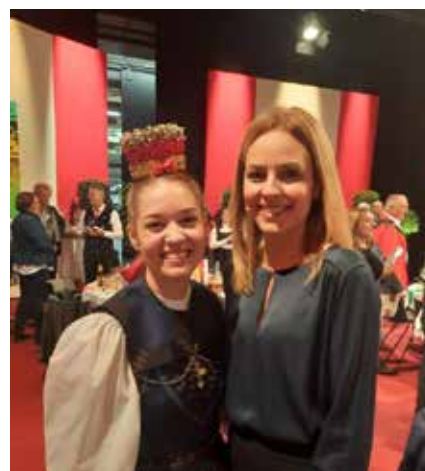
Unsere Trachten-trägerin mit ORF-Moderatorin Kerstin Polzer

Wir als Trachtenverein freuen uns über die Endplatzierung der Üble Schlucht auf dem 3. Platz und sind ganz besonders stolz, dass wir das Laternsertal in Wien vertreten durften.