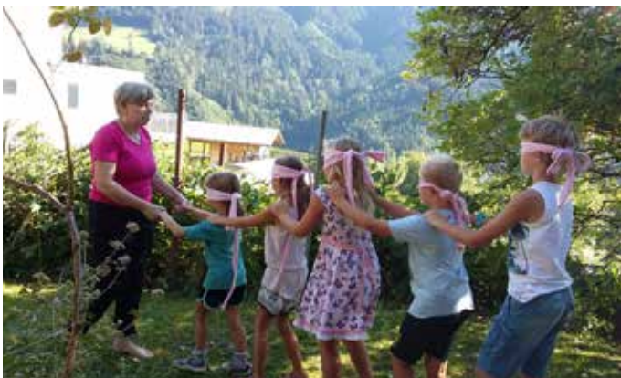
„Blinde Kuh“ im Gänsemarsch