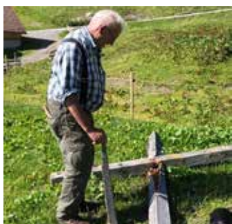
Entstehung „Gapfohler Kreuz“

Auch die Jungmannschaft des Schivereins blieb nicht untätig. Ein abwechslungsreiches Sommertrainingsprogramm, welches unter dem Motto „Summer in the nature“ durchgeführt wurde, förderte die Sportlichkeit und den Zusammenhalt der Kaderläuferinnen und -läufer und vergrößerte ihre Vorfreude, um top motiviert und voller Elan nach dem Herbsttraining, in die Wintersaison zu starten. Um unseren schibegeisterten Kids adäquate Unterstützung und Betreuung zu kommen zu lassen, wurden im Sommer und im Herbst von einigen Trainerinnen und Trainern Fortbildungen in Salzburg und am Stubaitaler-Gletscher besucht.