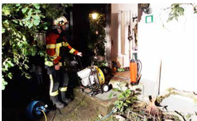
Entrauchung mittels Hochleistungslüfter

Die Alarmierung zum Einsatz erfolgte per Pager um 22:25 Uhr. Nach der Erkundung wurde das Belüftungsgerät in Stellung gebracht und das Haus belüftet. Die unterste Schublade des Holzherdes wurde entfernt und das Papier, welches sich hinter der Schublade befand ins Freie gebracht und abgelöscht. Mittels Wärmebildkamera wurde noch der Bereich des Ofens auf weitere Glutnester kontrolliert.