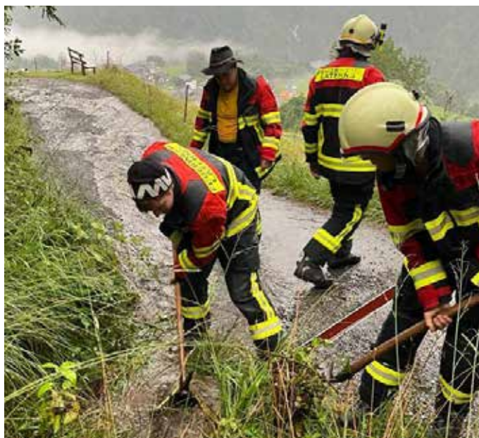
Freimachen von Schächten und Wasserabläufen

Aufgrund eines Starkregenereignisses kam es zu einem Wassereintritt in einem Keller. Um 18.22 Uhr erfolgte die Alarmierung der Feuerwehr Laterns welche mit 36 Einsatzkräften ausrückte. Das eingetretene Wasser wurde mittels Tauchpumpe ausgepumpt. Weiters wurden noch Straßen und Wege im ganzen Gemeindegebiet kontrolliert. Dabei wurden verschiedene Schächte und Wasserabläufe freigemacht, damit das überschießende Wasser in den jeweiligen Rinnen und Gräben abrinnen und keinen Schaden anrichten konnte.